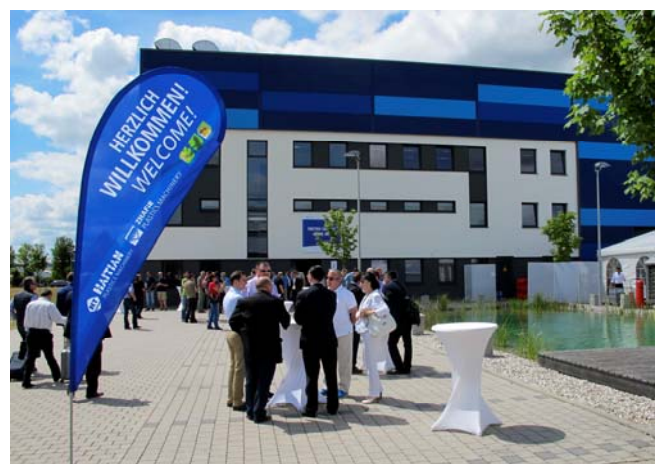
HAITIAN Open House u fabrici ZHAFIR, Nemačka

mašina u svojoj konkurenciji. Kombinujući dva sistema, servo-električni pogon i hidrauliku (hibridna mašina), Zeres elegantno premošćuje jaz između tradicionalno hidraulično orijentisanih proizvođača i najnovijih trendova u oblasti potpuno električnih brizgalica. Po svojim ključnim karakteristikama, Zeres je identičan potpuno električnoj mašini Venus II , što znači da nudi maksimalnu dinamičnost i preciznost proizvodnje, uz dvocifrenu uštedu energije i znatno nižu cenu u odnosu na potpuno električne brizgalice.